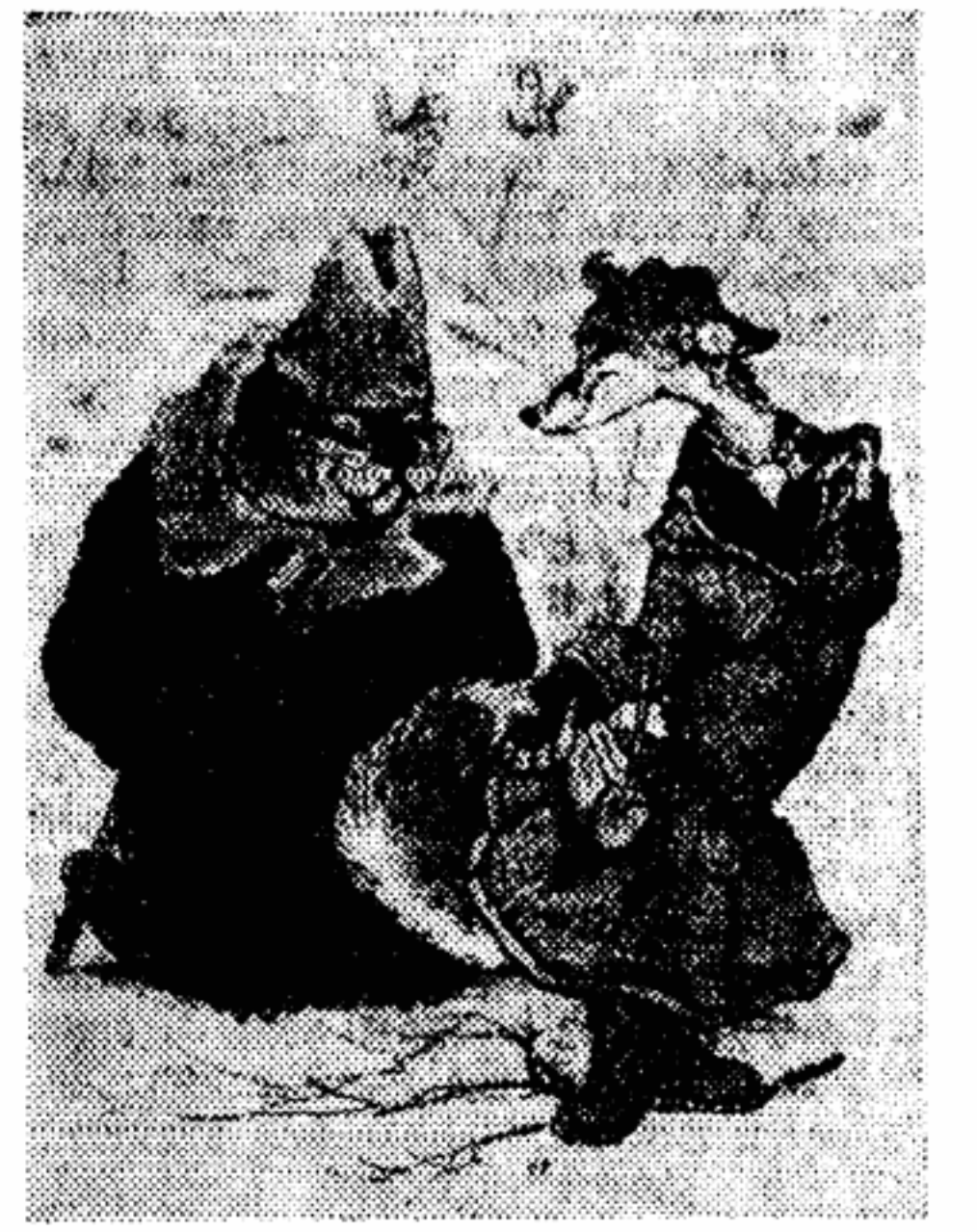
Иллюстрация к сказкам Салтыкова-Щедрина

Зато отвратительные базарные копии, вульгаризирующие и опошляющие самое понятие о великих мастерах, можно видеть в бесчисленном количестве. Держу пари, что нет районного центра, где бы не висели отвратительные пародии на шикшиновское «Тро в сосновом лесу» или «Охотники на привале» Перова. Бессовестные копистов никто не контролирует. Я видел в одной из гостиных знаменитую «Незнакомку» Крамского, восседающую в своем роскошном ладо на фоне... гостиной «Москва», я видел шикарных мишек, но уже не в сосновом лесу, а в... зоопарке. И никому в голову не при-